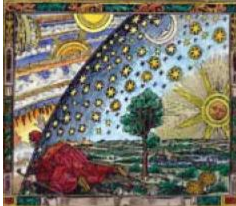
Observador de Estrellas

... eran muy a menudo los creadores o los miembros de las llamadas “ Colegios invisibles ”, y a menudo empleaban la plutocracia ellos mismos – llamada “Venecianos Negros”.