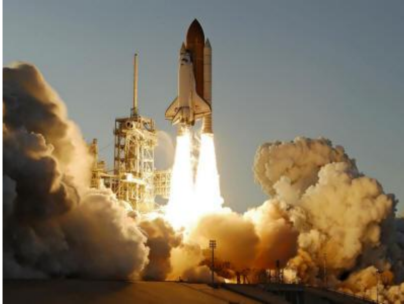
Space Shuttle Atlantis

Si el lector no puede sentir por la Tierra, ni incluso por la humanidad, talvez pueda sentir por sus propios ancestros en particular, su propio linaje, aquellos abuelos y abuelas que sudaron y perecieron como animales en los campos y en las fábricas, en batallas y guerras, de pobreza y enfermedad, y quienes, en su agonía, miraron hacia arriba al creador, preguntando, ¿Por qué? ¿Porqué?, ¿Porqué?