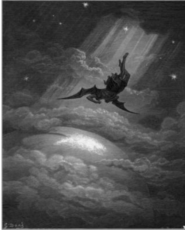
La caída de Lucifer por Gustave Doré

La Biblia toma la posición que los Nefilim eran una presencia maligna, e insiste que sus líderes cometieron un gran “pecado” interfiriendo con la evolución de la humanidad: