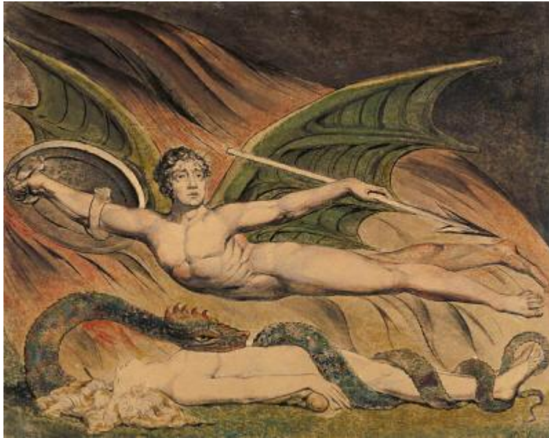
Satan y Eva por William Blake

(Joseph Campbell, Mitología Occidental )