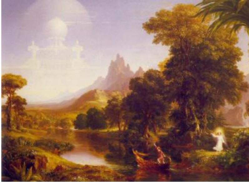
Juventud por Thomas Cole

Atlántida no era un centro avanzado de civilización humana, pero, más bien era la creación de y el hogar de seres alienígenas que colonizaron la Tierra. Hay más de 30,000 textos de todas partes del mundo que hablan de esta visita, y estos son solo aquellos textos que han permanecido intactos a través de los milenios.