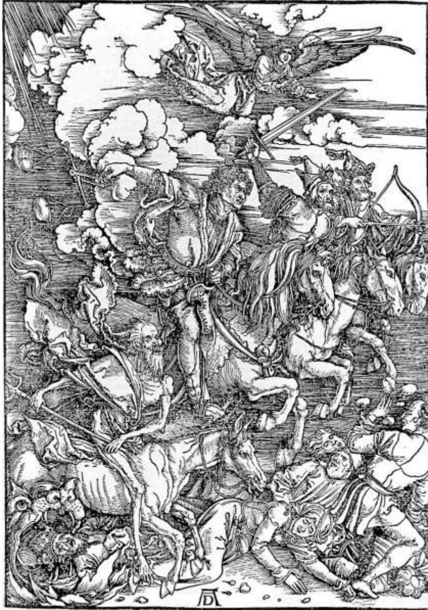
Albrecht Durer – Los Cuatro Jinetes del Apocalipsis

Artistas y ministros de tiempos más recientes también han tenido el mismo macro-tema en sus creaciones, aunque pocos son conscientes de ello ... consideren las líneas finales de la canción "Escalera al Cielo", por Led Zeppelin, y luego porqué millones resuenan con esta y otras piezas magistrales sin saber conscientemente porqué. (Ver Apéndice A.)